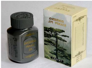
Ginseng kianpi pil

Введена новая категория «Загрязненный продукт». Если спортсмен смог доказать незначительный характер своей вины или небрежности при употреблении продукта, содержащего запрещенную субстанцию, которая не была указана производителем, срок его дисквалификации может быть сокращен от выговора до двух лет.