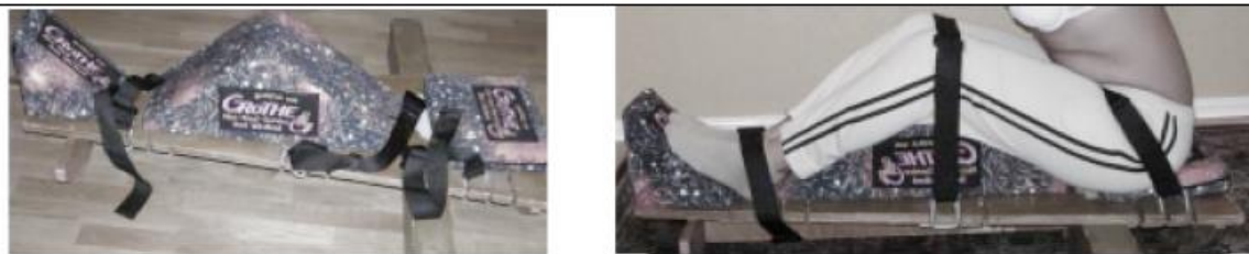
Рисунок 1: Испытательная доска для теста

2.10 Таблица описывает тесты, которые должны проводиться на испытательной доске, и система подсчета: