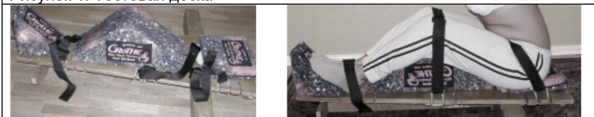
Рисунок 1: Тестовая доска